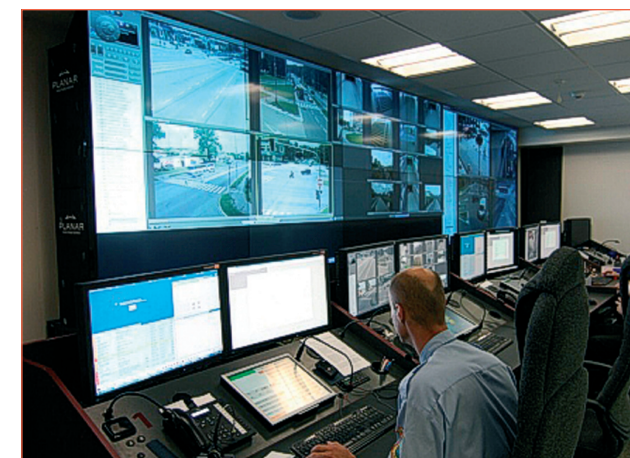
Kamerový dohled města Ostravy.

Při volání na čísla tísňového volání je nutno uvádět u adresy místa mimořádné události i obec, protože všechny tyto hovory v Moravskoslezském kraji jsou směřovány na Integrované bezpečnostní centrum v Ostravě.