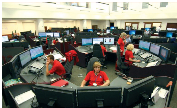
Integrované bezpečnostní centrum Moravskoslezského kraje.

Nikdy nezavěšujte, dokud Vás k tomu operátor tísňové linky nevyzve (potřebuje např. upřesnit informace o Vámi nahlášené mimořádné události).