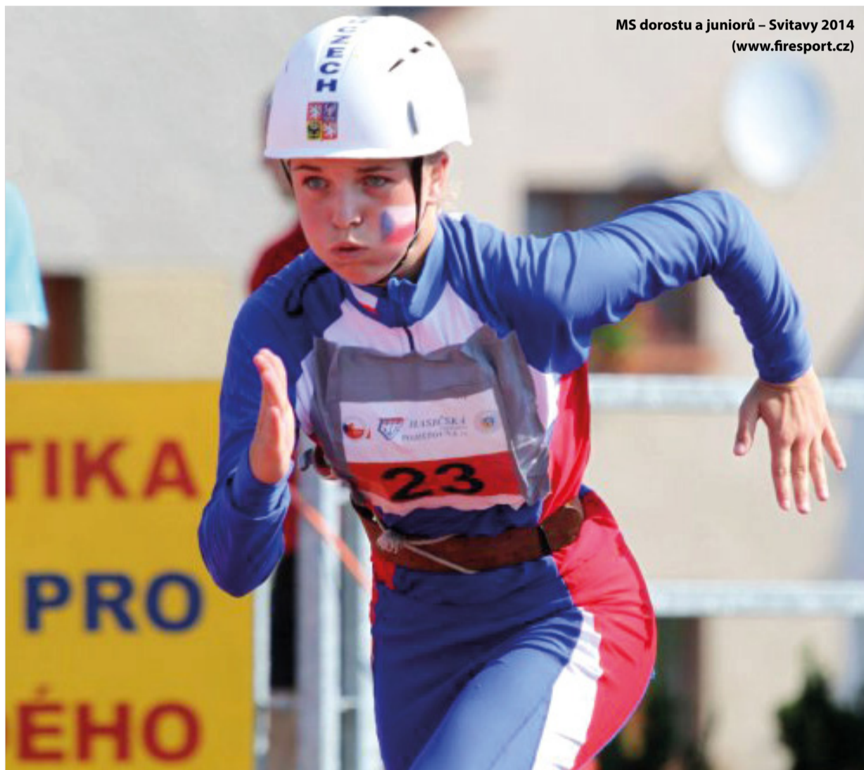
MS dorostu a juniorů – Svitavy 2014

Očekávaná účast je 50 až 60 družstev sportovců z 16 až 20 zemí světa , tedy na 600 závodníků a členů realizačních týmů . Akci pomůže zajistit více jak 100 dobrovolníků především z řad členů Sdružení hasičů Čech, Moravy a Slezska , kteří se zachovali skvěle a bezprostředně poté, co bylo o konání akce u nás rozhodnuto, se sami hlásili jako