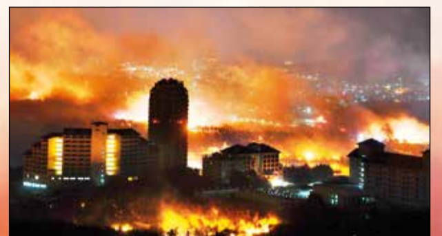
Oheň ohrožuje moderní město.