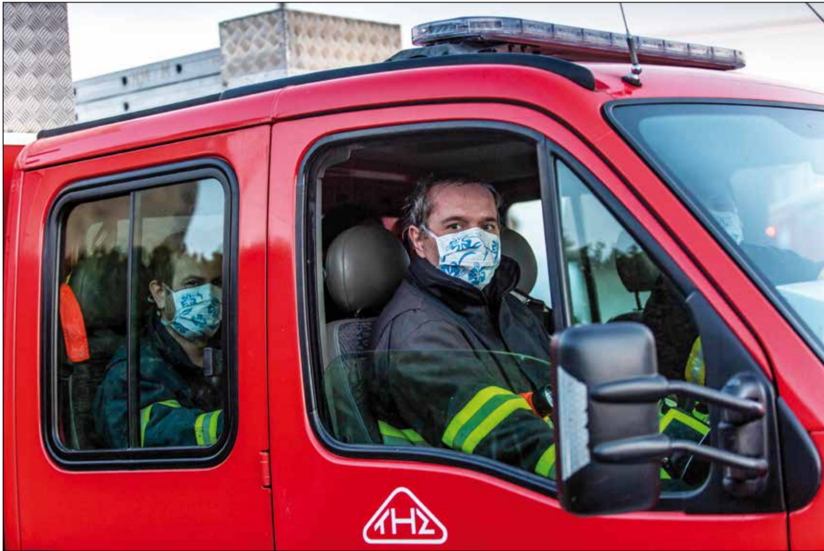
Sobě ku cti, obci ku prospěchu, bližnímu ku pomoci.