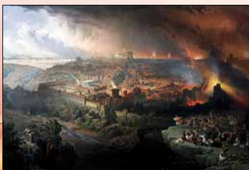
Oheň jako zbraň antického světa. Hořící Jeruzalém.

Připravil Mirek Brát