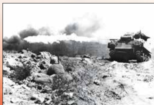
Plamenometry se brzy dočkaly montáže i na obrněná vozidla včetně tanků.