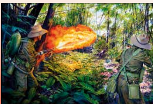
Plamenometry se staly efektivní zbraní i při boji v džungli.