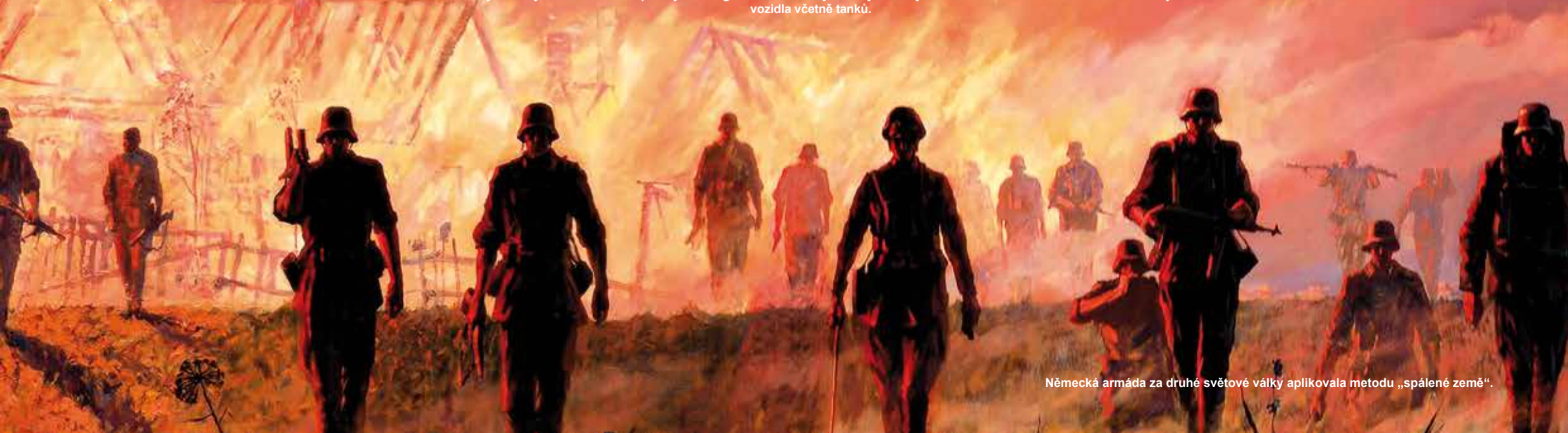
Německá armáda za druhé světové války aplikovala metodu „spálené země“.