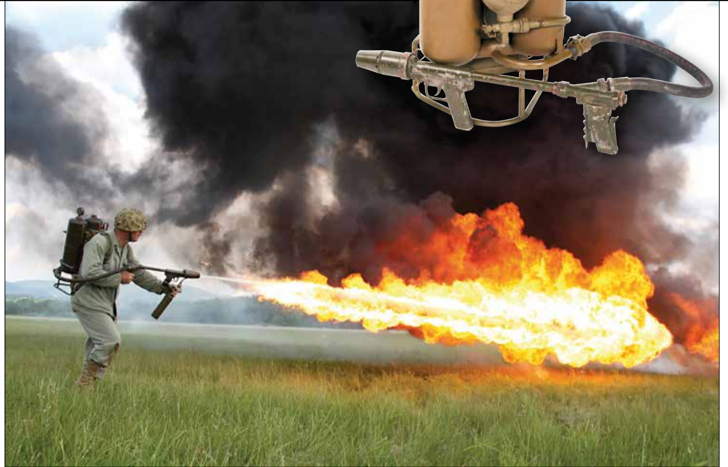
Oheň jako zbraň

Oheň byl ve vojenství někdy využíván nikoli jako přímá zbraň,